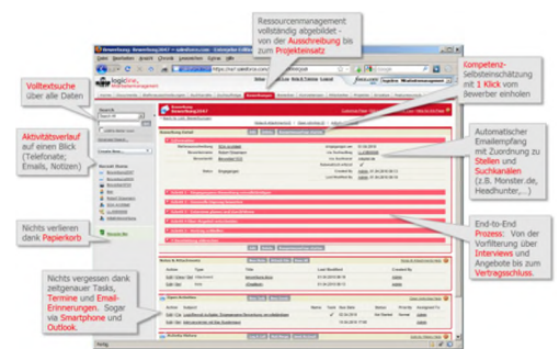
Vorgefertigte Lösungsbausteine z.B. für Recruiting

Wir unterstützen Sie tatkräftig bei Konzeption, Entwicklung, Einführung und Betreuung Ihrer Applikationen. Von der einfachen Anpassung bis zur komplexen Apex- und Visualforce-Programmierung.